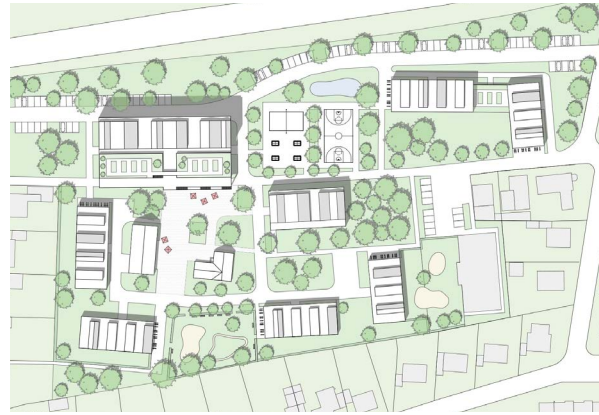
Wohncampus Telgte, Telgte