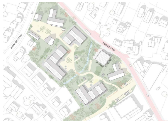
Rasenmäher & Rosengärten, Ostbevern