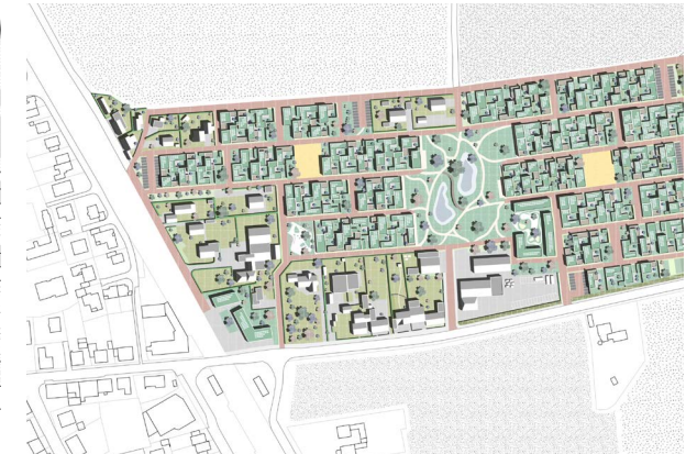
Mach mir den Hof, Drensteinfurt-Rinkerode