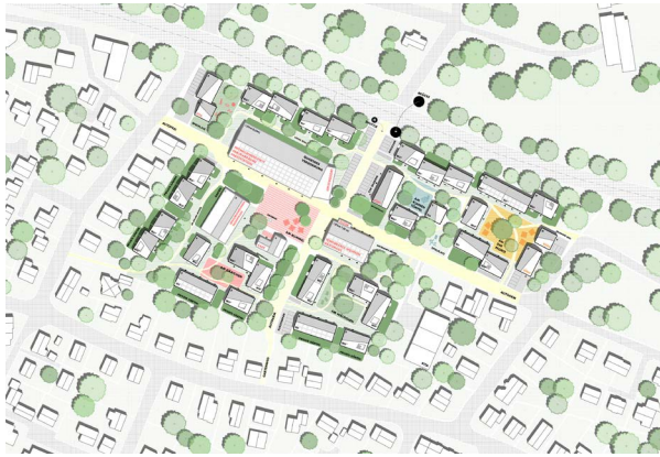
Telgte wächst zusammen: Quartier der Vier Höfe, Telgte