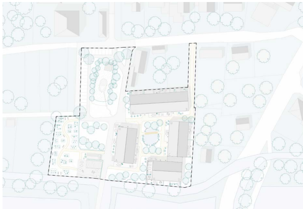
Lebensphase +, Sendenhorst