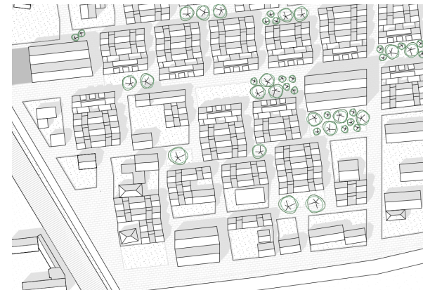
Die neue Altstadt, Drensteinfurt-Rinkerode