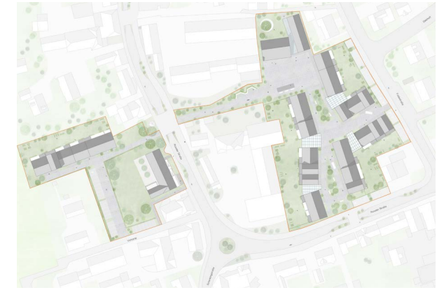
Ideal Dorf 2040, Nottuln-Schapdetten