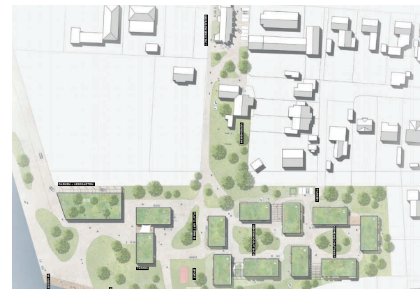
Canal Connects, Greven-Schmedehausen