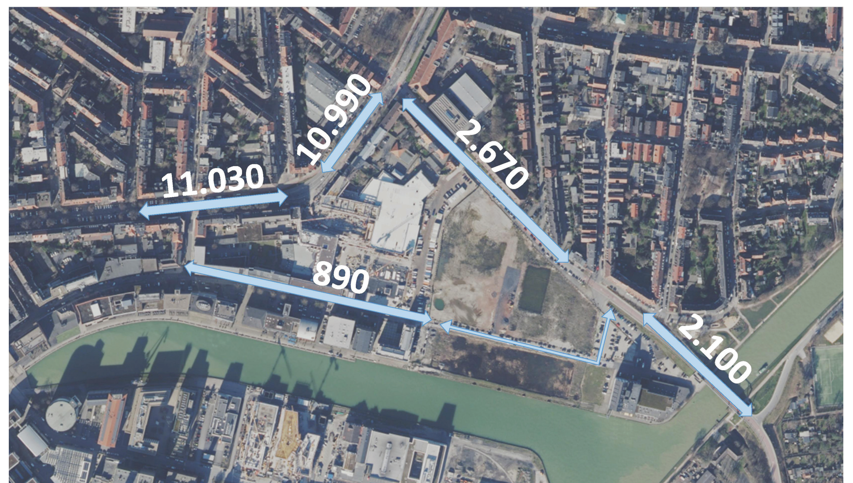
2023 Bestandssituation (Kfz/24h)