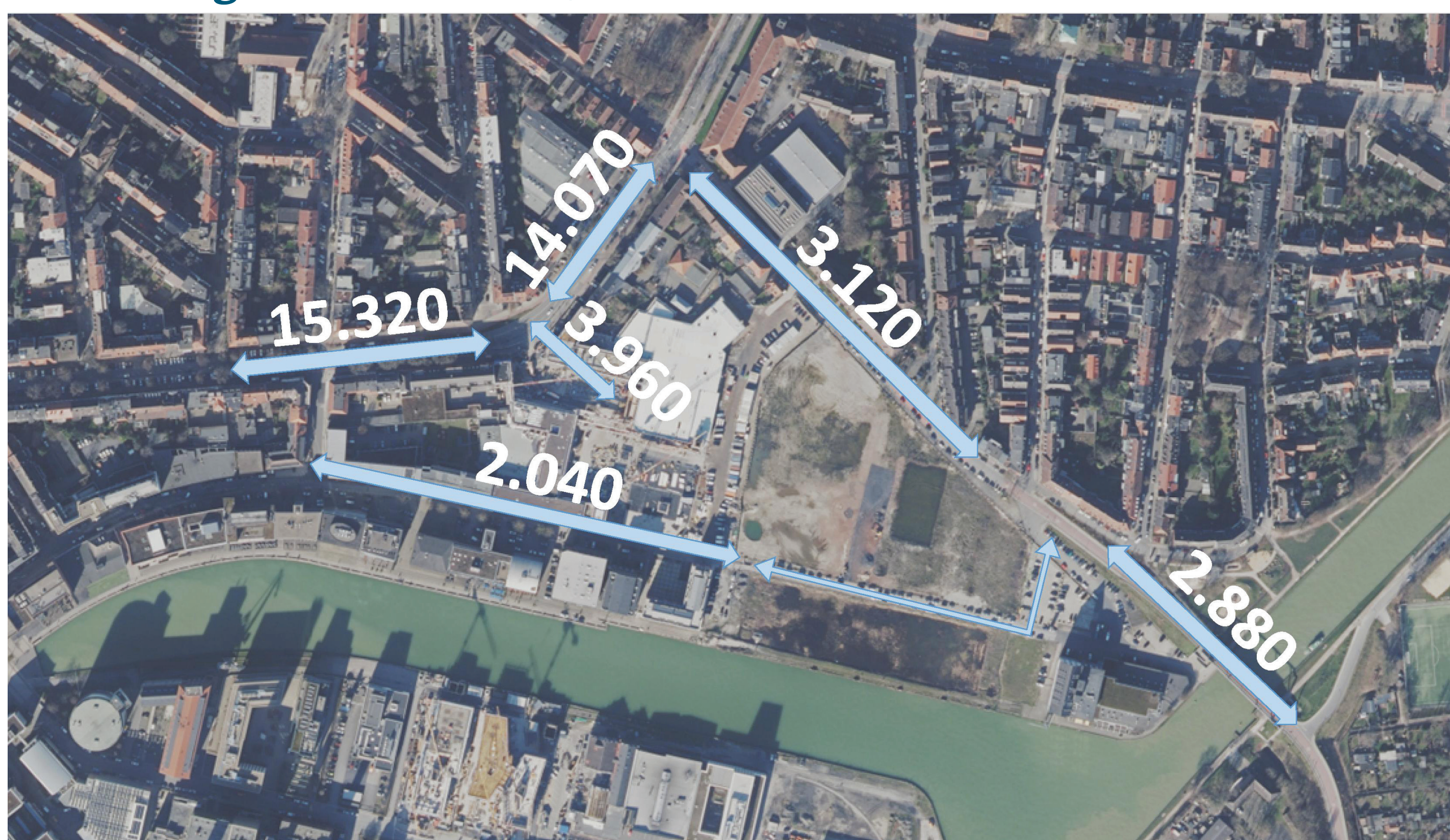
2035 Prognose Nullfall (Kfz/24h)