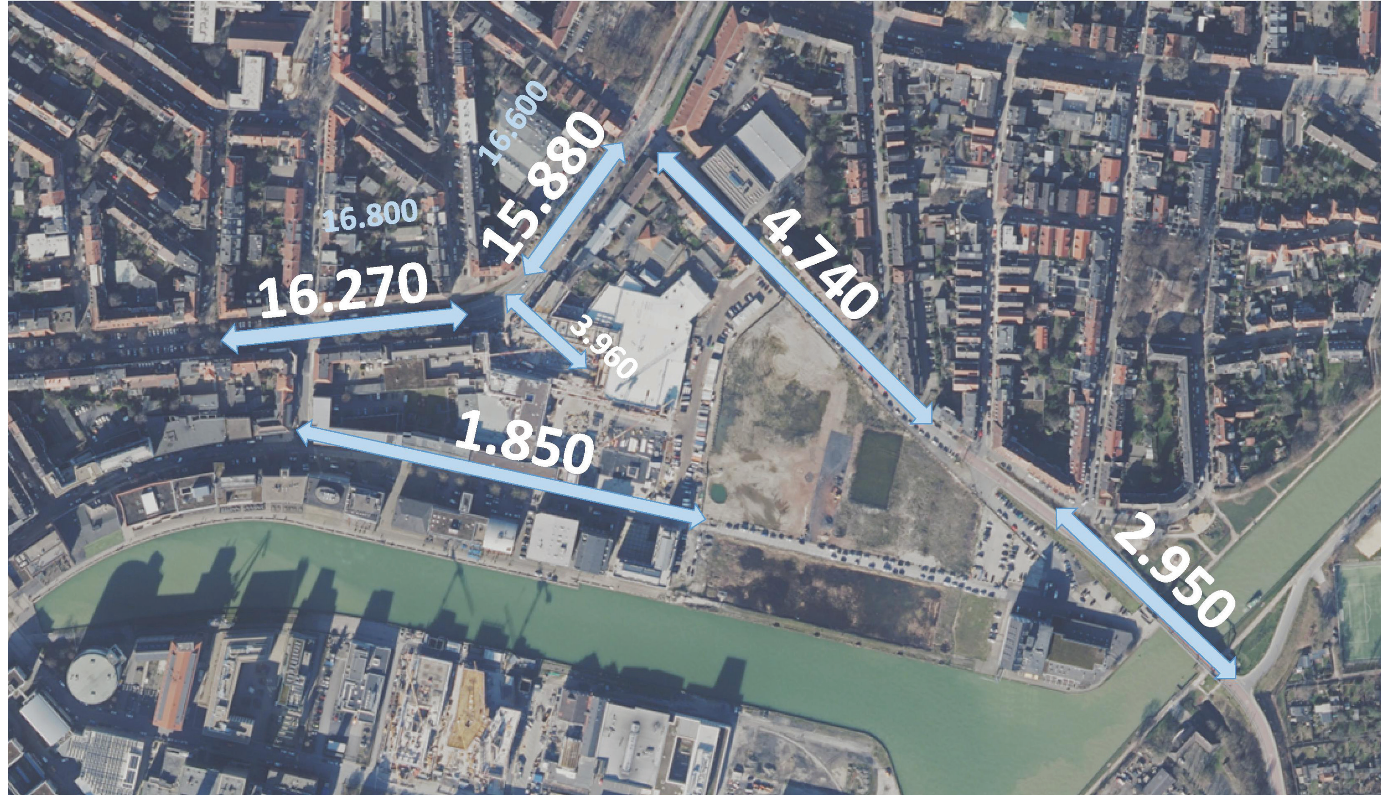
2035 Prognose ‚bestehendes Planungsrecht‘ (Kfz/24h)