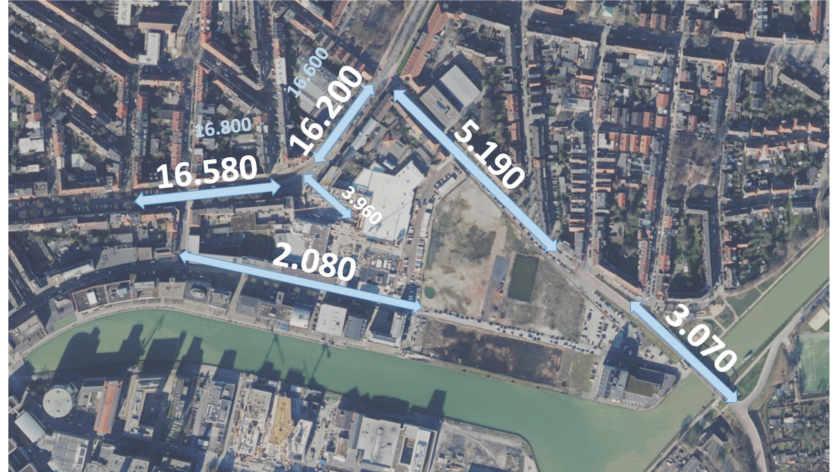
2035 Prognose Planfall (Kfz/24h)