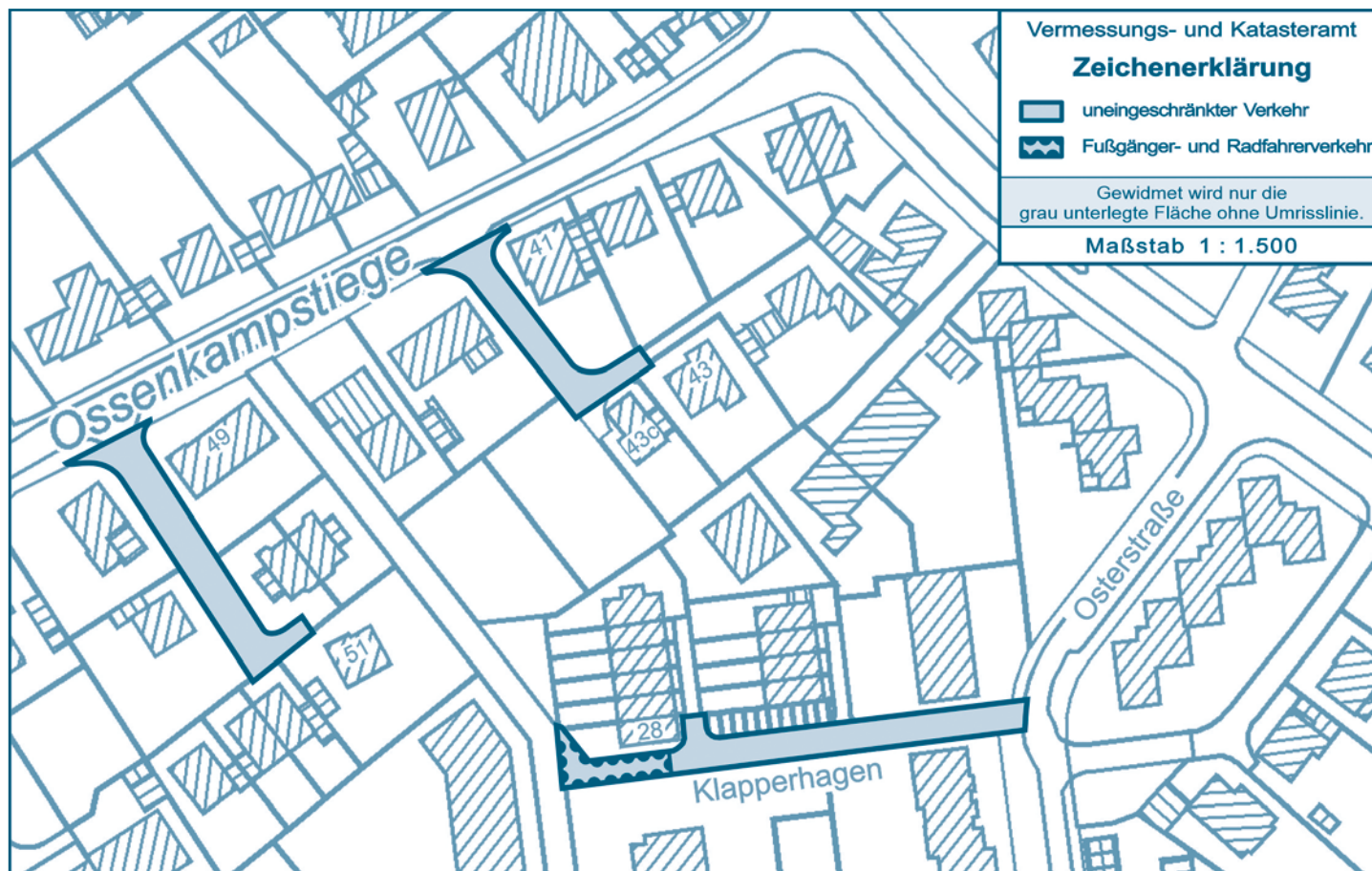
Übersichtsplan Nr. 2

Gemäß § 6 Abs. 1 Straßen- und Wegegesetz NRW werden folgende im Eigentum der Stadt Münster stehende Verkehrsflächen dem öffentlichen Straßenverkehr gewidmet: