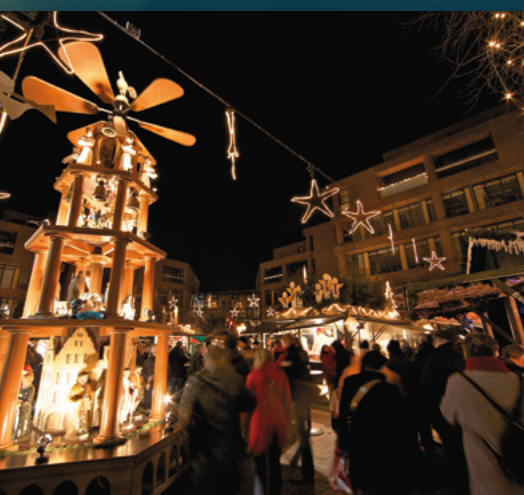
Aegidiimarkt Aegidiistraße 25.11.–23.12.

Handicrafts, special delicacies and student flair can be found at Münster's youngest Christmas market, held in front of the medieval walls of the Liebfrauen-Überwasserkirche, with a stunning view of the illuminated towers of St. Paulus Dom of Münster.