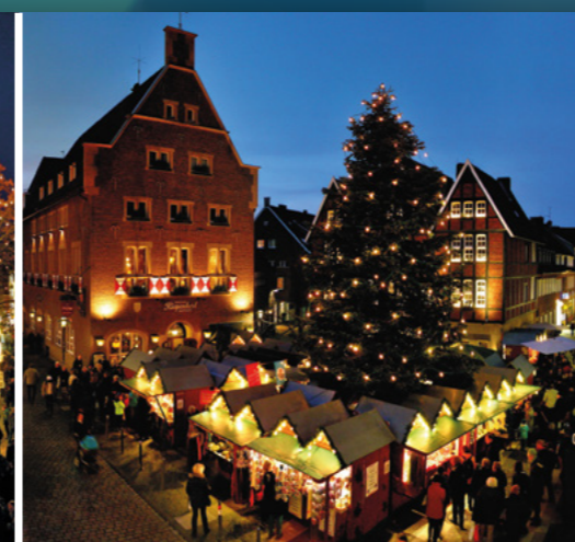
Am Kiepenkerl Spiekerhof 25.11.–23.12.