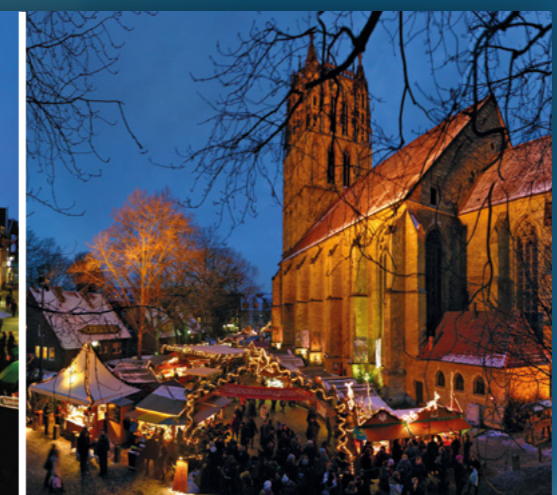
Überwasserkirchplatz Überwasserkirchplatz 25.11.–22.12.

Öffnungszeiten für alle fünf Innenstadt-Weihnachtsmärkte Openingstijden voor alle vijf de binnenstad-kerstmarkten Opening times for all five inner city Christmas markets