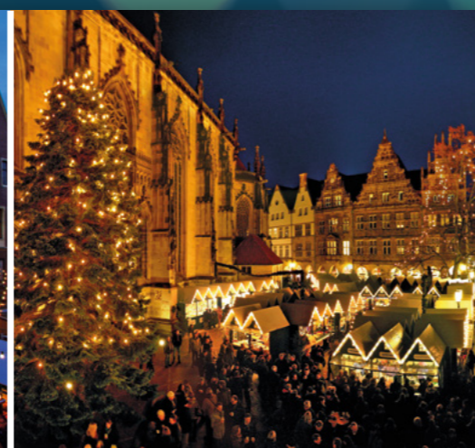
Lambertikirchplatz Salzstraße 25.11.–22.12.