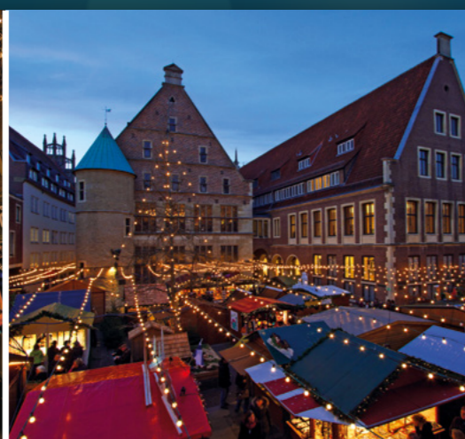
Rund um das Rathaus Klemensstraße 25.11.–23.12.