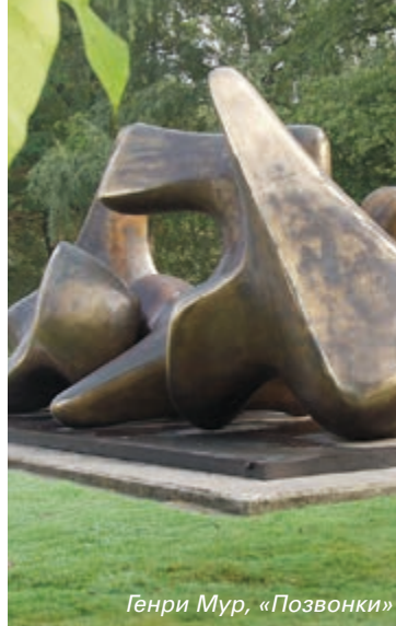
Генри Мур, «Позвонки»

А музыка! Ее язык интернационален, и при этом неважно, идет ли речь о выступлении Городского симфонического оркестра или концерте хора. Или же о популярном диск-жогее в одном из многочисленных клубов города.