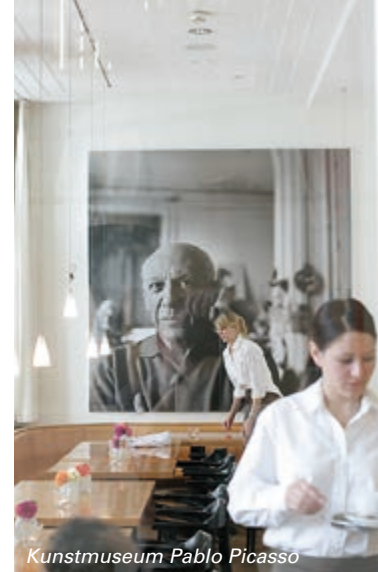
Kunstmuseum Pablo Picasso

Городская библиотека (Stadtbücherei) построена в 1993 г. в форме сдвоенного сооружения (архитекторы Джулия Боллес-Уилсон и Петер Уилсон). Бросается в глаза своенравная элегантность этого здания, а также удачное соотношение визуальных и пространственных осевых линий.