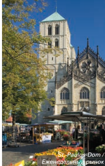
St.-Paulus-Dom / Еженедельный рынок

Schloss (Замок) с Botanischer Garten (Ботаническим садом) – трехфлигельное здание бывшей резиденции архиепископа, фасад которого богато украшен различными скульптурами, было построено архитектором И. К. Шлауном в 1767-1787 гг. Слева от главного здания находятся невысокие ворота, которые ведут в парк замка с его величественными старыми деревьями. В задней части парка находится Ботанический сад университета, заложенный более 200 лет назад.