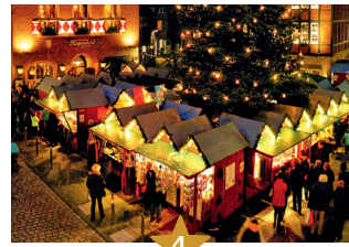
4 Weihnachtsdorf am Kiepenkerl