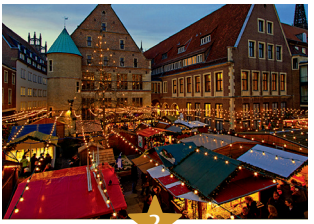
2 Weihnachtsmarkt rund um das Rathaus