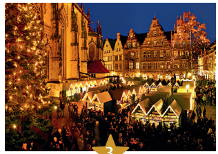
3 Lichtermarkt St. Lamberti