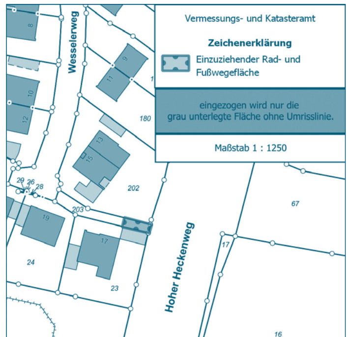
Übersichtsplan Nr. 3

Die Stadt Münster beabsichtigt, dem Rad- und Fußweg der vom südlichen Ende des Wesselerwegs zum Hohen Heckenweg führt, die Eigenschaft eines öffentlichen Wegs für den Radfahrer- und Fußgängerverkehr zu entziehen. Die Einziehung bezieht sich auf die Benutzung durch Radfahrer und Fußgänger.