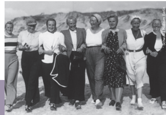
Schwules Museum Berlin

Seit 2024 befindet sich die Ausstellung auf Wanderschaft durch Deutschland.