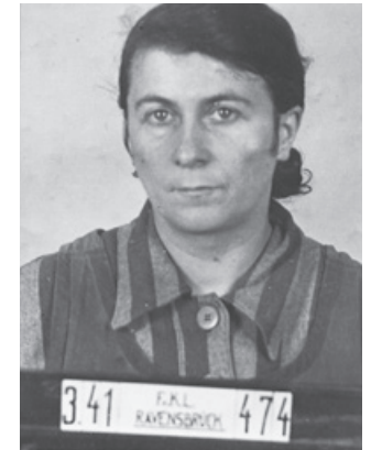
Hessisches Hauptstaatsarchiv Wiesbaden

Die Informationstexte der Ausstellung sind in deutscher Sprache und digital über QR-Codes auch in englischer Sprache verfügbar.