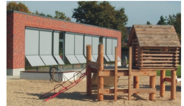
Ansicht von Süden