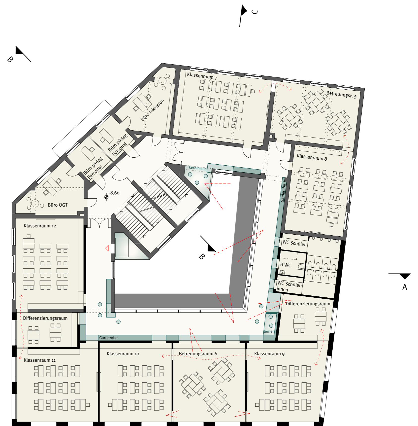
Grundriss 2. Obergeschoss M 1:200