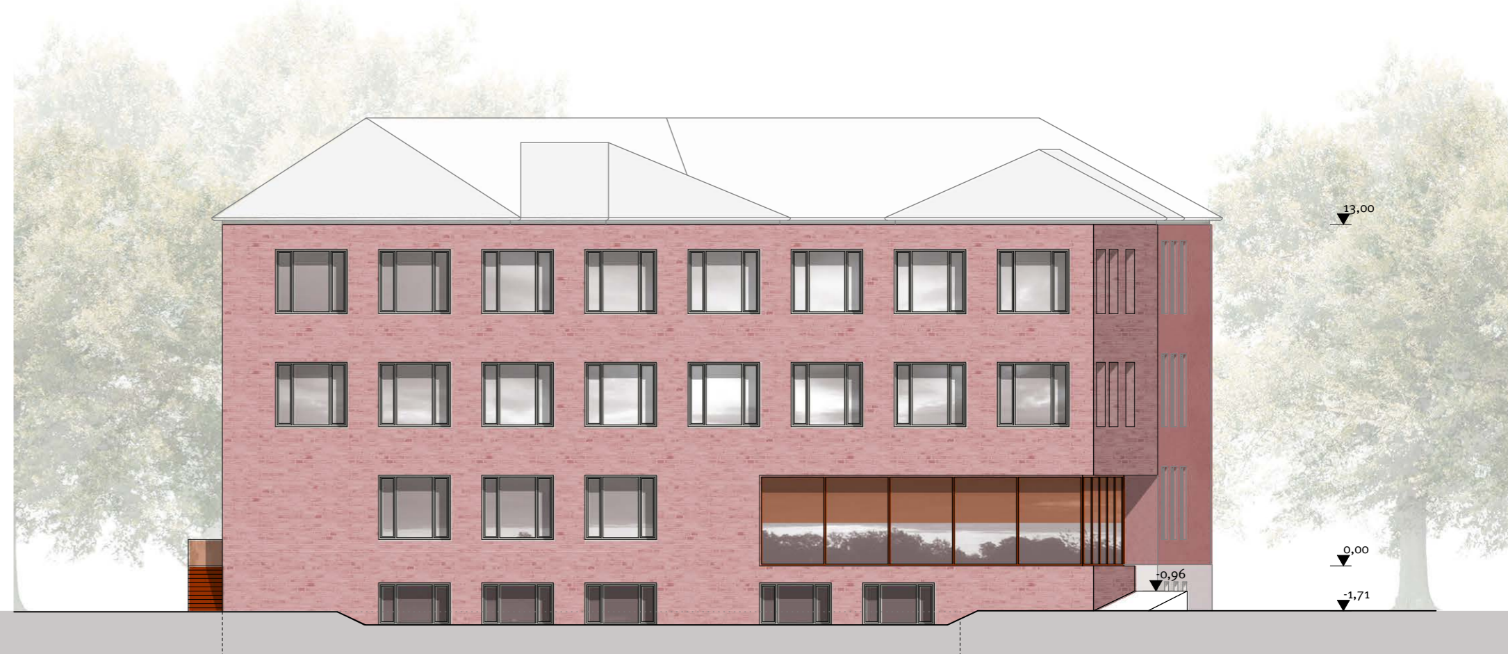
Ansicht West M 1:200