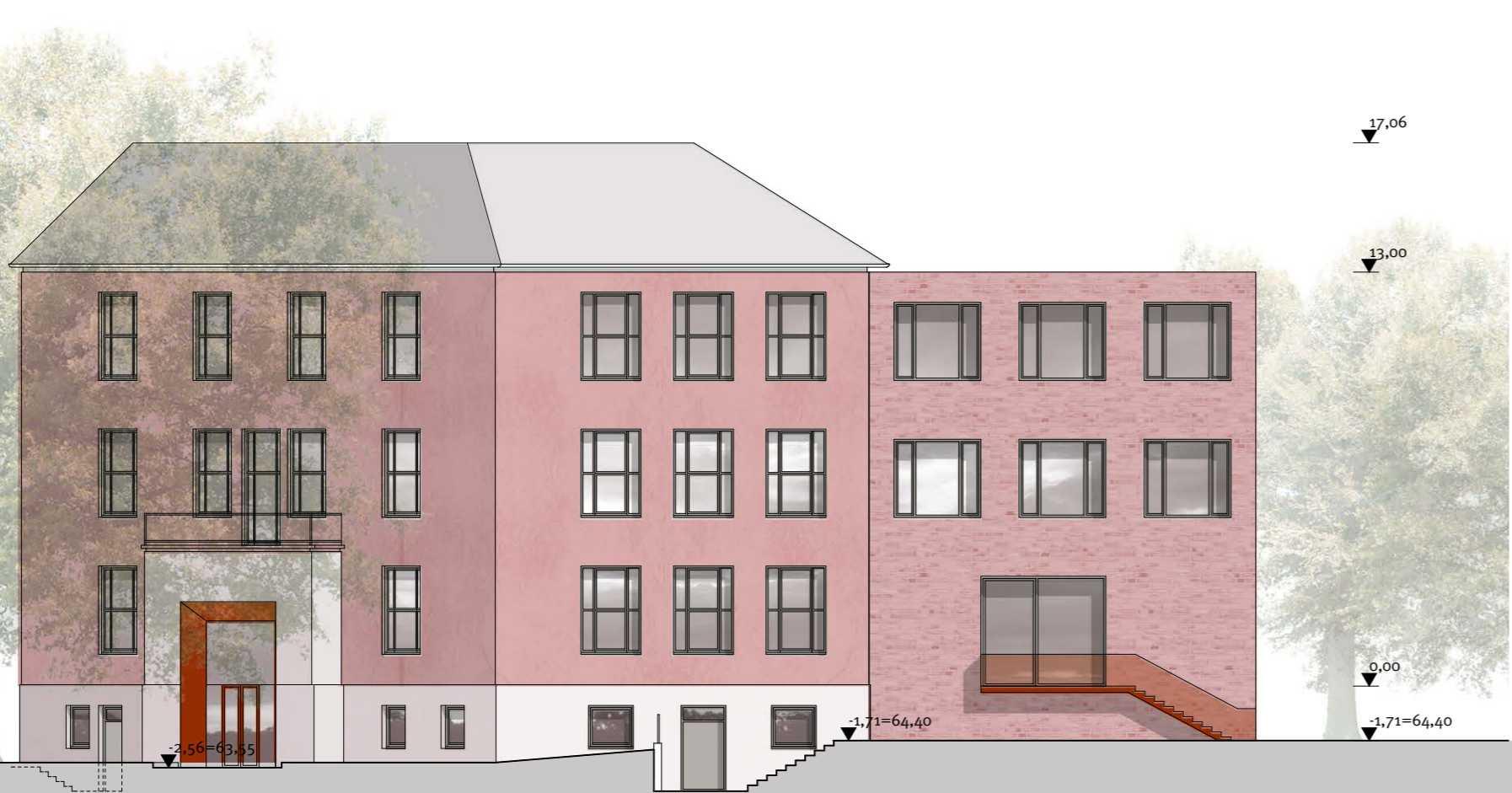
Ansicht Ost M 1:200