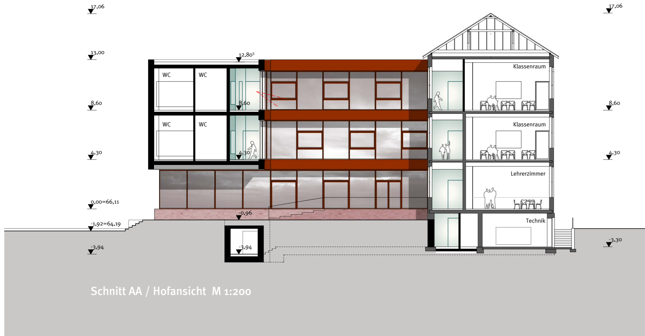
Schnitt AA / Hofansicht M 1:200