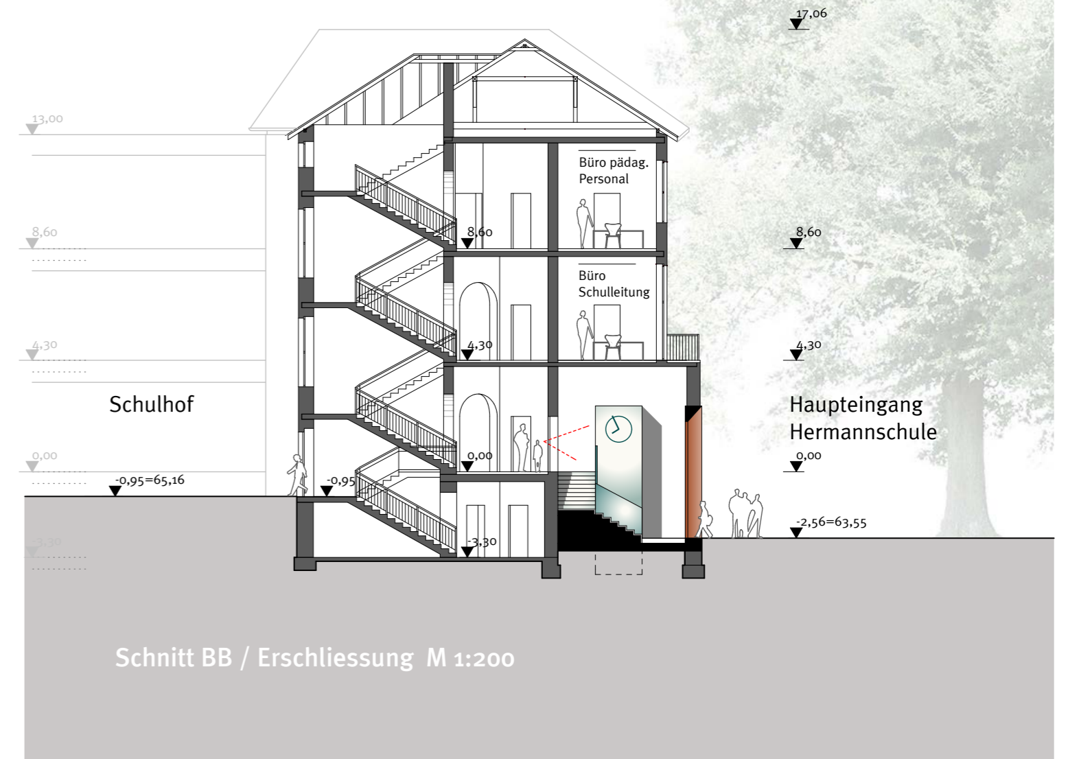
Schnitt BB / Erschliessung M 1:200