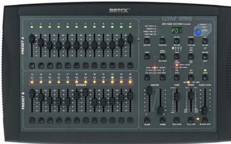
Botex Controller DMX DC-1224