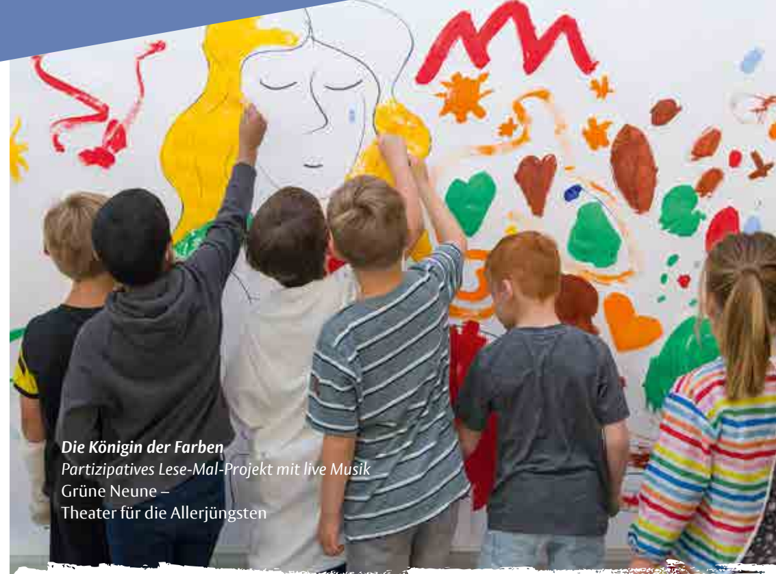
Die Königin der Farben Partizipatives Lese-Mal-Projekt mit live Musik Grüne Neune – Theater für die Allerjüngsten