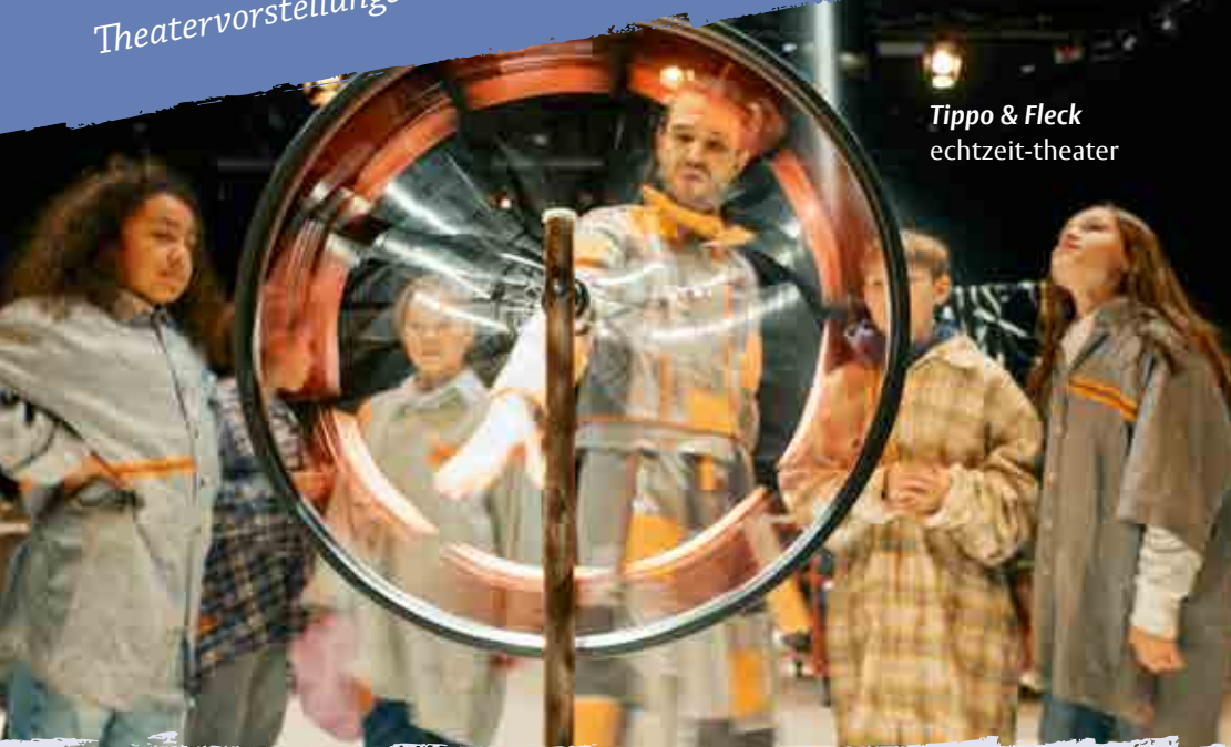
Tippo & Fleck echtzeit-theater