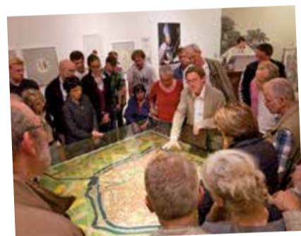
Im Mittwochstreff mit Dr. Alfred Pohlmann werden ausgewählte Themen zur Stadtgeschichte beleuchtet.