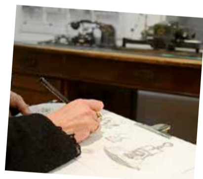
Den Blick schärfen und die Kreativität im Selbstversuch entfalten – das ist möglich im Zeichenkurs für Erwachsene unter fachlicher Anleitung.