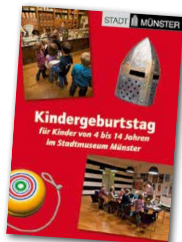
Im Stadtmuseum Münster können Kinder im Alter von 4–14 Jahren ihren Geburtstag feiern.