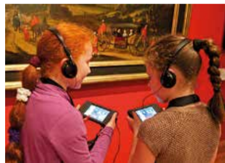
Mit unserem Multimediaguide können auch junge Besucher einen spannenden Rundgang durch die münsterische Stadtgeschichte unternehmen.