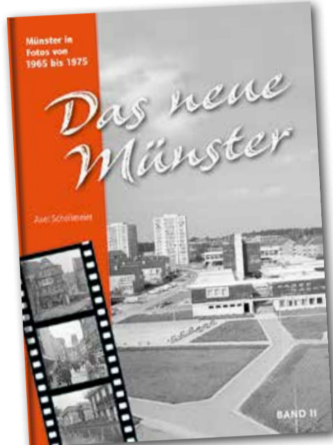
Das neue Münster – Band II. Münster in Fotos von 1965 bis 1975 (Aschendorff Verlag), € 16,80

TERMINE im Stadtmuseum Münster März bis August 2018