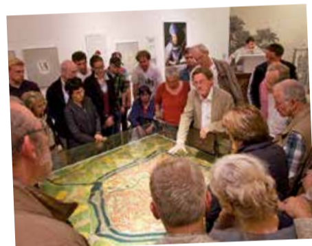
Im Mittwochstreff mit Dr. Alfred Pohlmann werden ausgewählte Themen zur Stadtgeschichte beleuchtet.