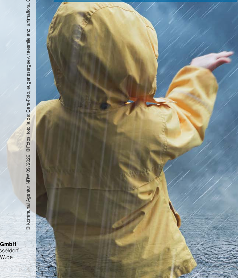
© Kommunal Agentur NRW 09/2022, © Fotos: fotolia.de: Cara-Foto, eugeneseregeev, taesmieleland, animalora, G. Sanders, Zerbor, E. Pokrovsky

Hinweise und Empfehlungen zum Schutz für sich und andere