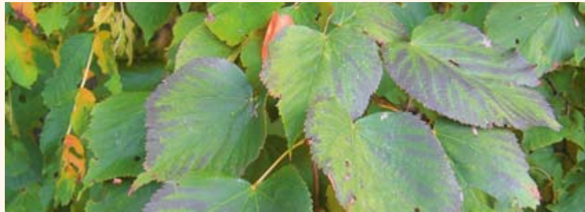
Herbstlaub der Sommerlinde