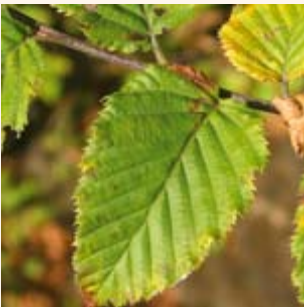
Herbstlaub der Hainbuche