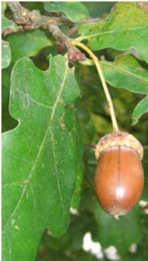
Fruchtstand und Blatt der Stieleiche