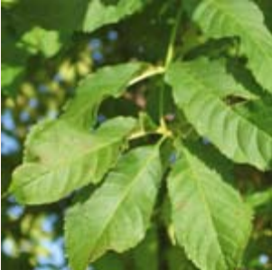
Blatt der Esche