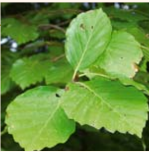
Blatt der Rotbuche