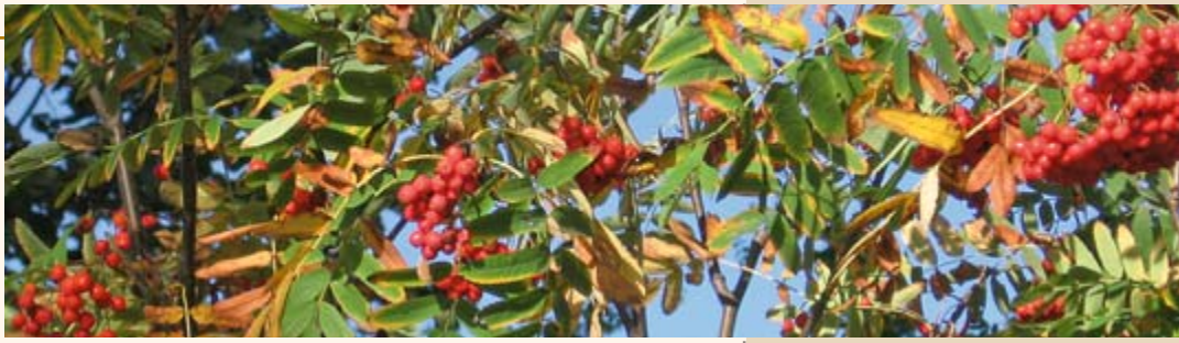
Früchte der Eberesche