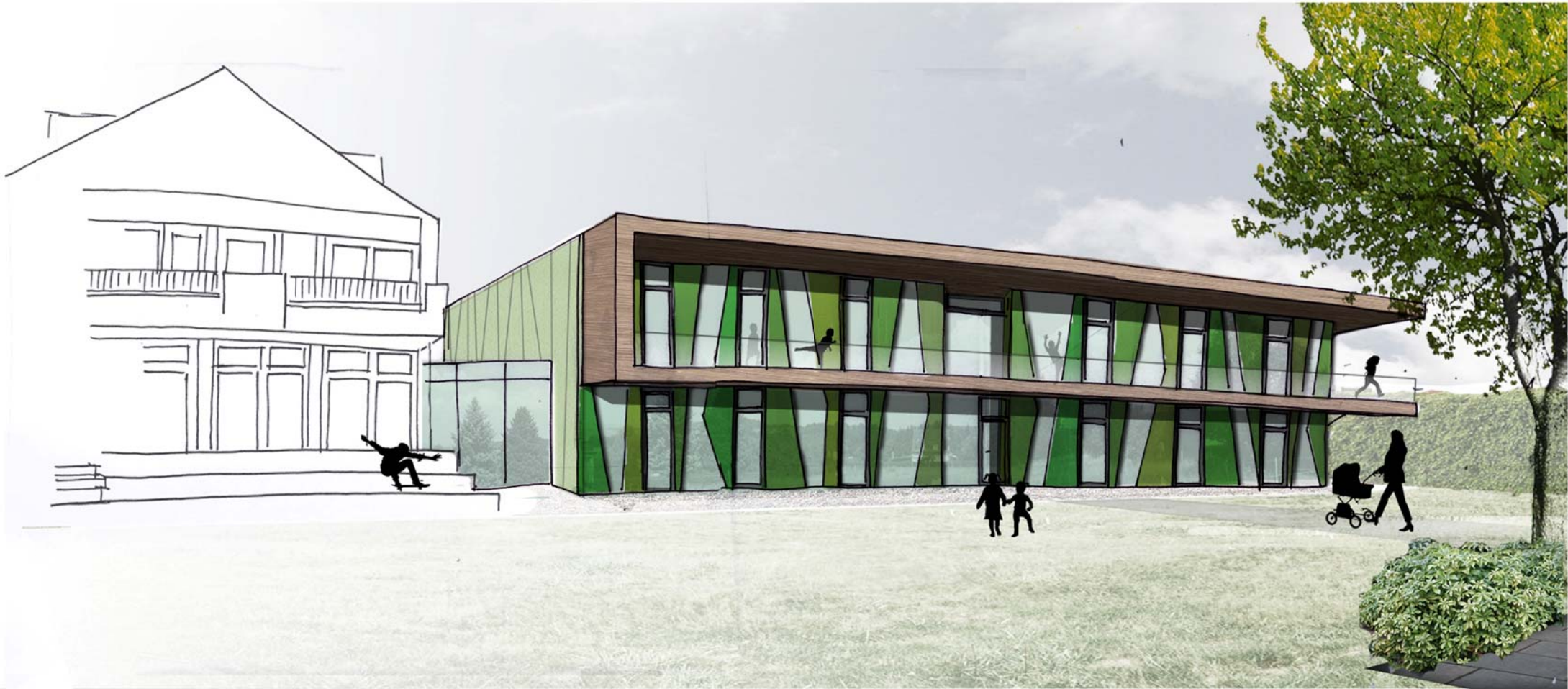
Kindertagesstätte am Johannes-Busch-Haus Perspektive Var 4