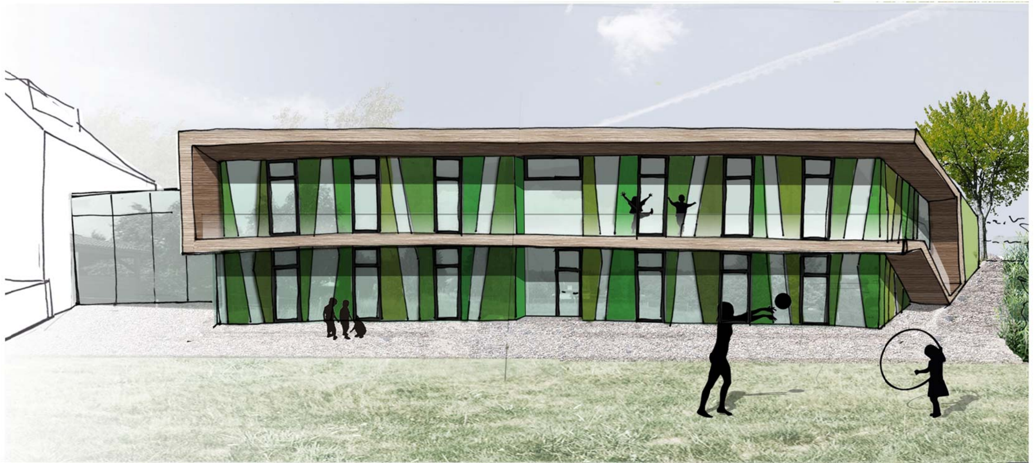
Kindertagesstätte am Johannes-Busch-Haus Perspektive Var 4