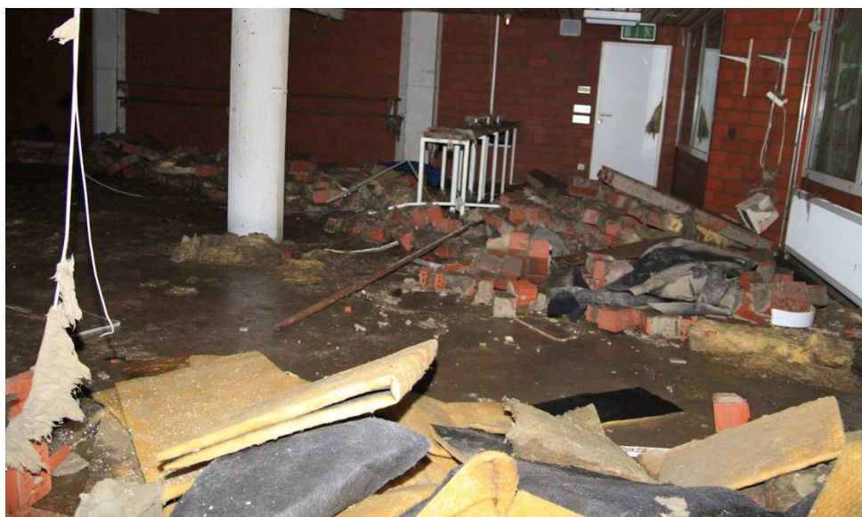
Kellergeschoss Bürgerhaus Kinderhaus