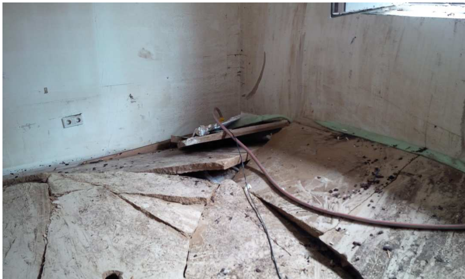
Zerstörter Fußboden in einem privaten Wohngebäude