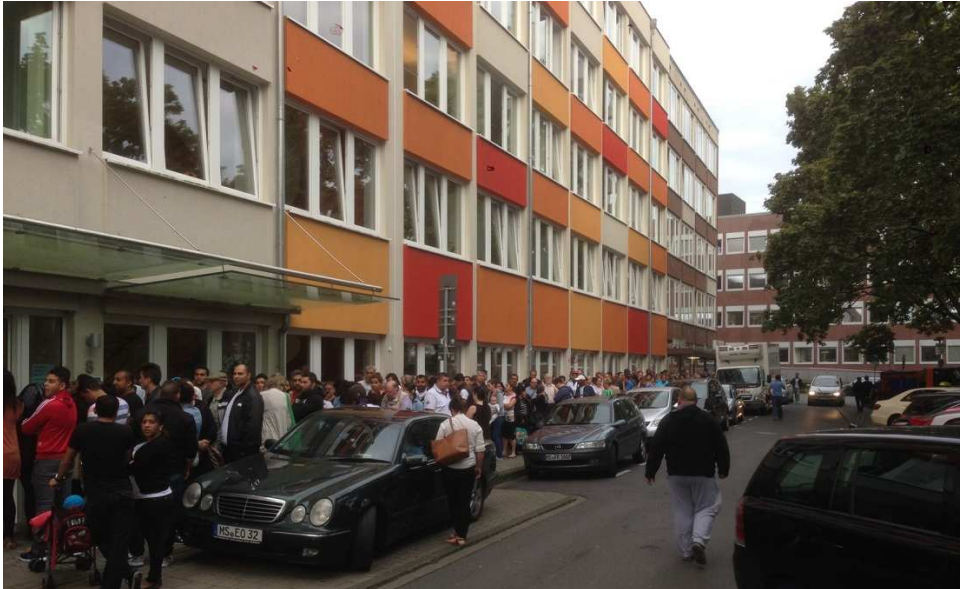
Warteschlange vor dem Sozialamt im Rahmen der Soforthilfe