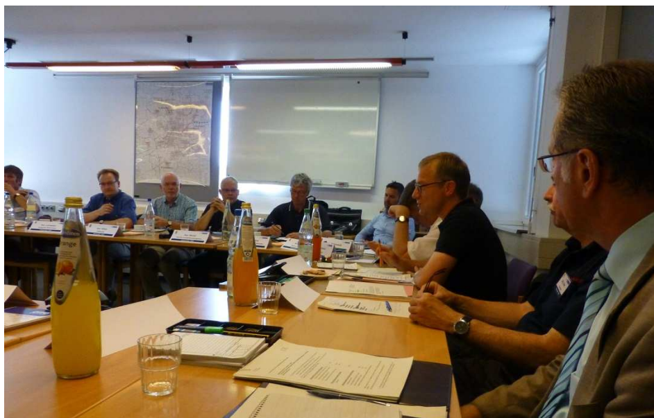
Sitzung des Krisenstabes