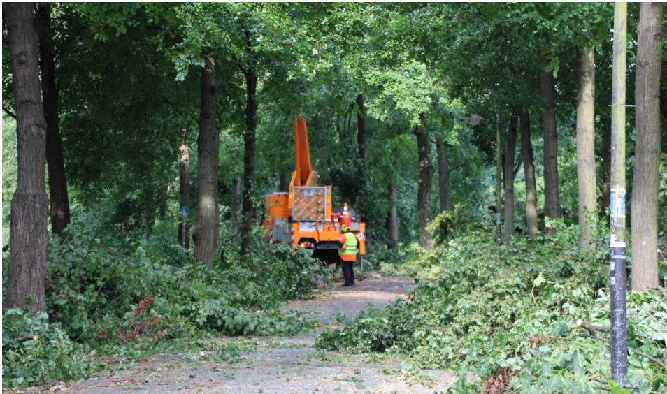
Aufräumarbeiten in der Promenade