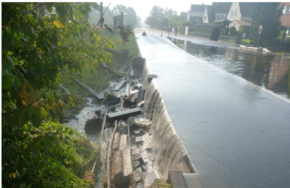
Überflutete Straße in Handorf