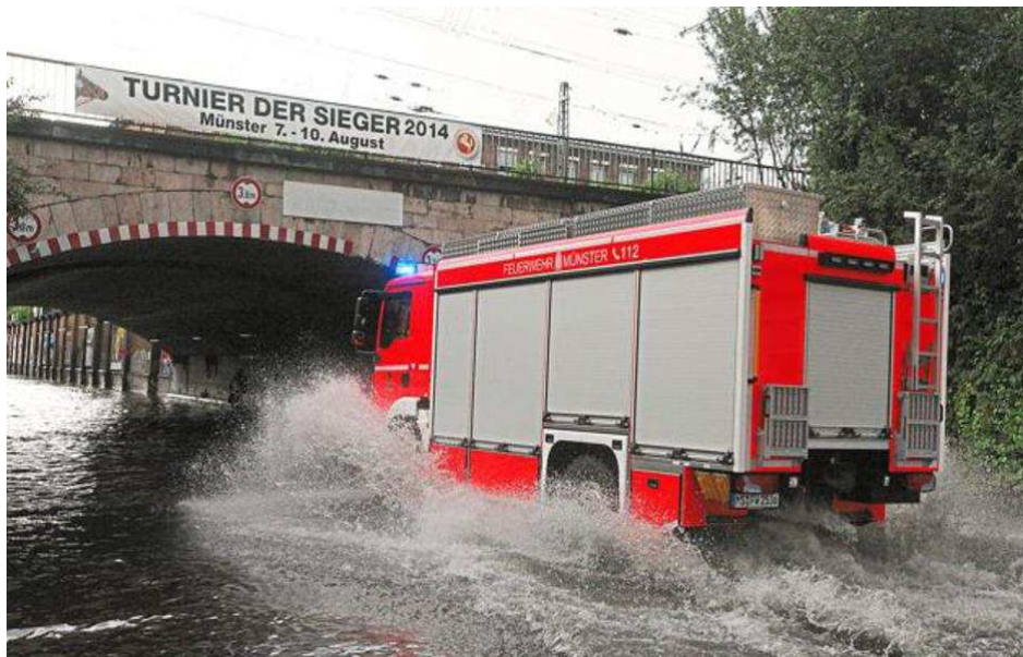
Einsatzfahrzeug der Feuerwehr an der Bahnbrücke Hafenstraße