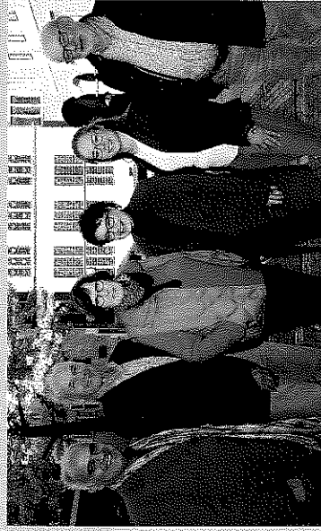
Das Team der Ombudsstelle